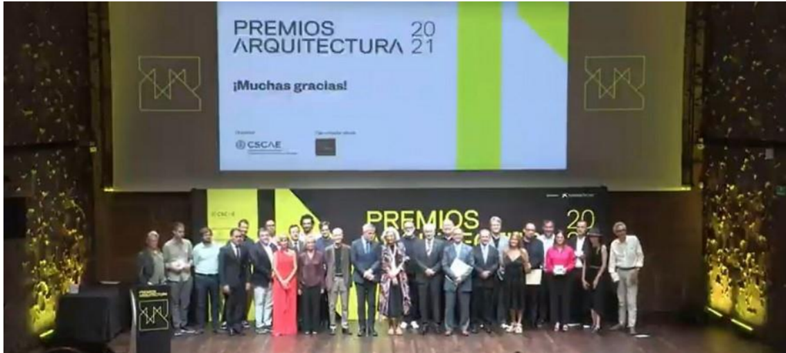
Los nueve ganadores de la primera edición de los Premios Arquitectura del CSCAE en la gala celebrada en CaixaForum Madrid.

Organizados por el Consejo Superior de los Colegios de Arquitectos de España CSCAE, los premios cierran su primera edición con una emocionante gala conducida por la arquitecta, actriz y presentadora Leonor Martín, en la que, por primera vez, el nombre de las nueve obras ganadoras se ha conocido en vivo y en directo.